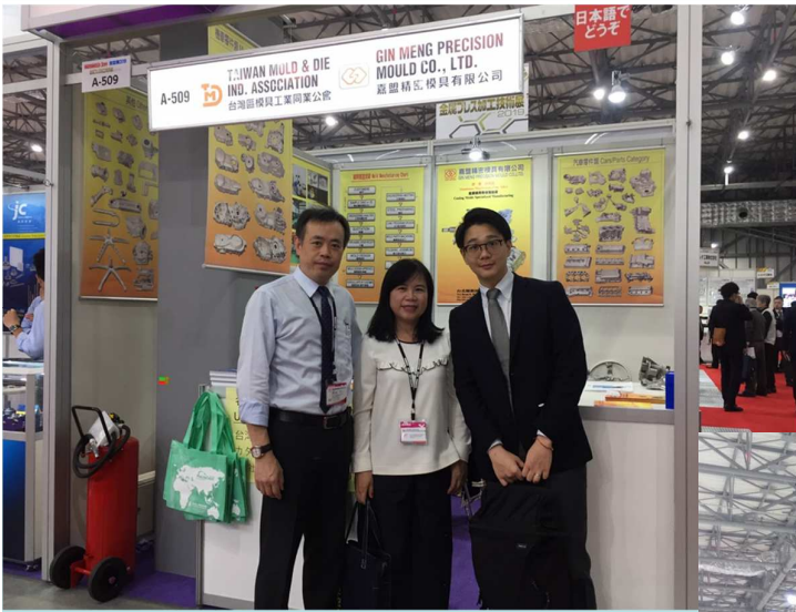
第三天一早進場的人潮