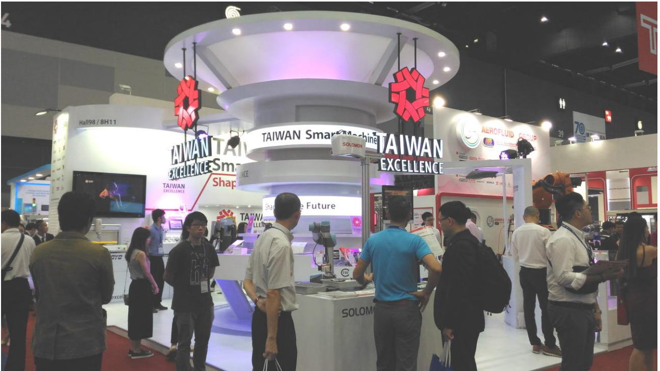
▲2019 年泰國國際模具及設備展 -台灣精品館